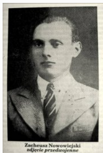
Zacheusz Nowowiejski zdjęcie przedwojenne